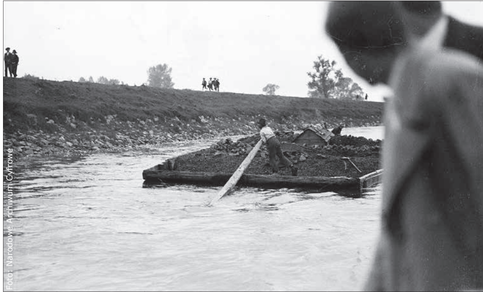
Galar z węglem na Górnej Wiśle. Zdjęcie z roku 1932.

dem był rozwój przemysłu, szczególnie górnictwa, na Górnym Śląsku. Przede wszystkim spławiano wtedy węgiel. Na Przemszy szlak zaczynał się u zbiegu Czarnej i Białej Przemszy, czyli w miejscu, które dziś nazywane jest Trójkątem Trzech Cesarzy. Jeden z portów załadunkowych