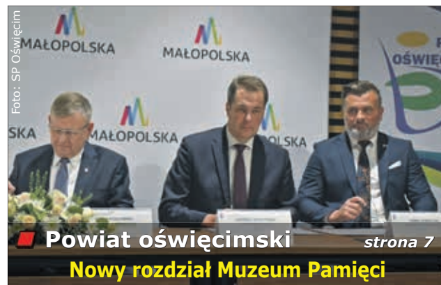
Powiat oświęcimski strona 7 Nowy rozdział Muzeum Pamięci

Pięć lat starań przyniosło wreszcie skutek. Gmina Lanckorona otrzymała dofinansowanie na rewitalizację ruin zamku na Górze Lanckorońskiej. Prace już się rozpoczęły i potrwać do końca roku. Oznacza to, że teren został zamknięty dla odwiedzających. Szczegóły na stronie 3.