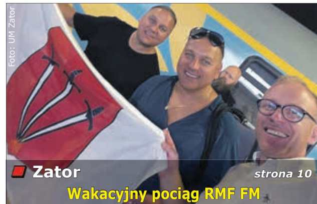
Zator strona 10 Wakacyjny pociąg RMF FM