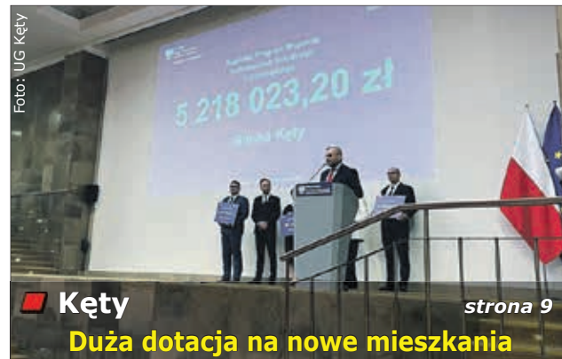
Kęty strona 9 Duża dotacja na nowe mieszkania

To bardzo dobra wiadomość dla mieszkańców naszego regionu. Już niebawem pomiędzy Andrychowem a Wadowicami pojawią się nowe połączenia. Dzięki dofinansowaniu ze środków Funduszu Rozwoju Przewozów Autobusowych między obu miastami uruchomionych zostanie 19 kursów. Szczegóły na stronie 3.