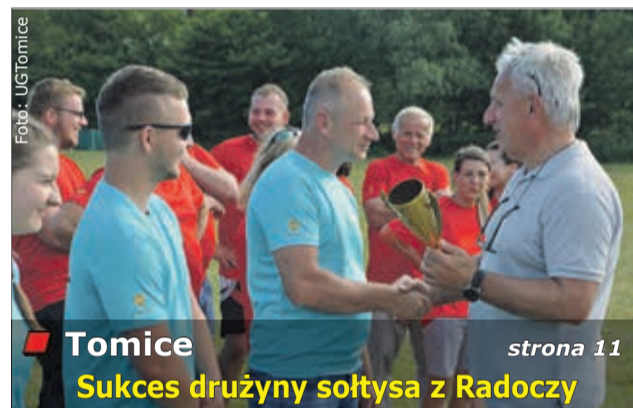
Tomice Sukces drużyny sołtysa z Radoczy strona 11