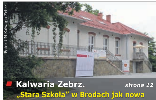
Kalwaria Zebrz. „Stara Szkoła” w Brodach jak nowa strona 12