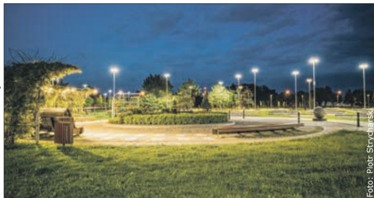
Park Zasole nocą