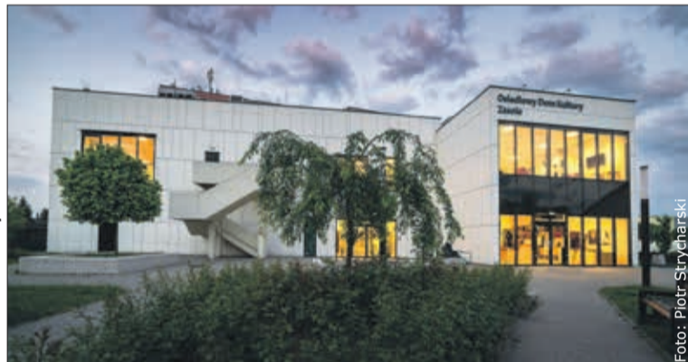
Osiedlowy Dom Kultury na Zasolu