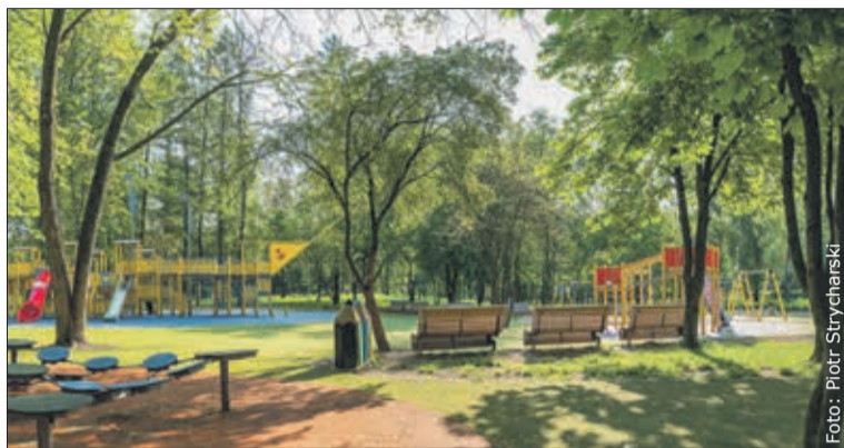
Park Pokoju na osiedlu Chemików