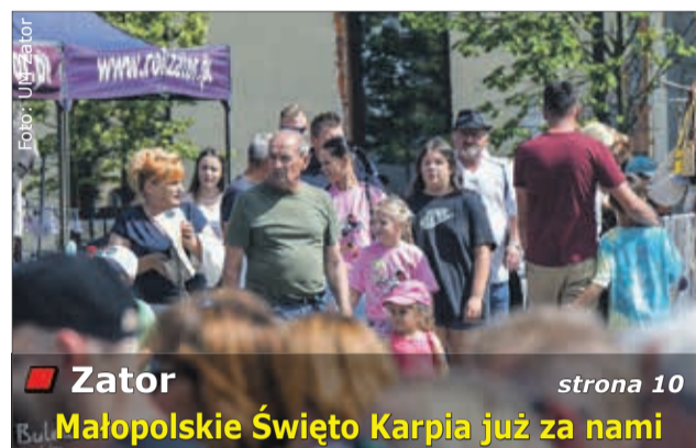
Zator Małopolskie Święto Karpia już za nami strona 10