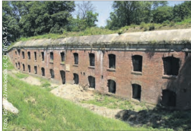
Zamiast w Andrychowie, twierdza powstała w Przemyslu. Na zdjęciu jeden z jej elementów – Fort XV „Borek”.

z 56 fortów zlokalizowanych na wzgórzach wokół miasta. Największy z fortów – artyleryjski – miał