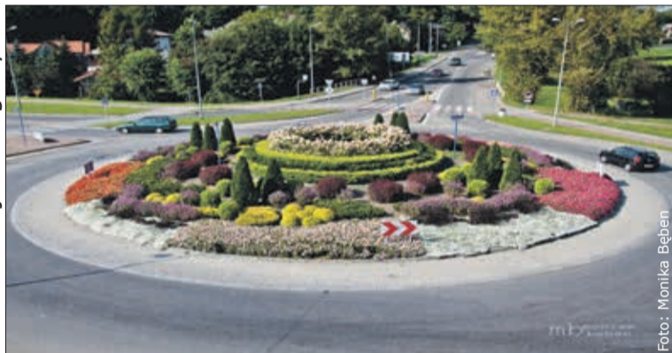
Kolorowe rondo u zbiegu ul. Zatorskiej i ul. Jagiełły