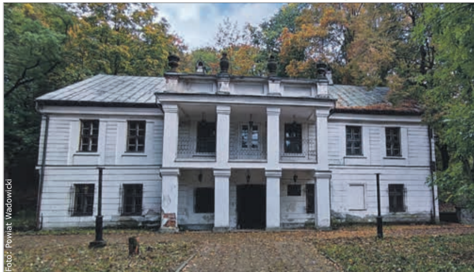
Renowacji poddany zostanie m.in. dworek E. Zegadłowicza w Gorzeniu Górnym.

sce powstania organizacji nie jest przypadkowe. Około 1/4 zakładów obuwniczych w Polsce mieści się na terenie województwa małopolskiego, głównie w okolicach miasta nad Cedronem. Nic więc dziw-