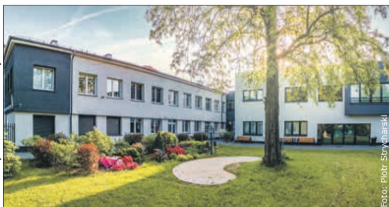
Dzienny Dom Pomocy