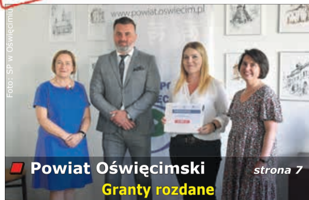
Powiat Oświęcimski Granty rozdane strona 7