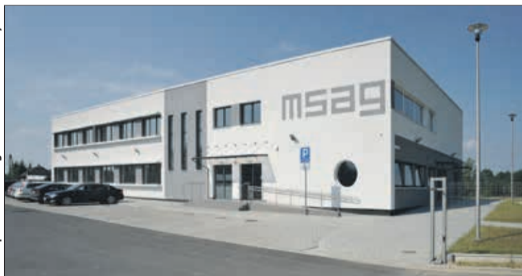
Miejska Strefa Aktywności Gospodarczej „Nowe Dwory”