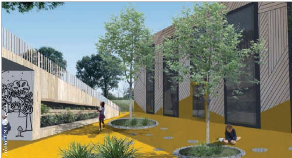
Trwa budowa kompleksu oświatowego, Wizualizacja.

– Budowa żłobka i przedszkola jest jednym z zadań, które zapisałem w swoim programie wyborczym. Wierzę, że mimo